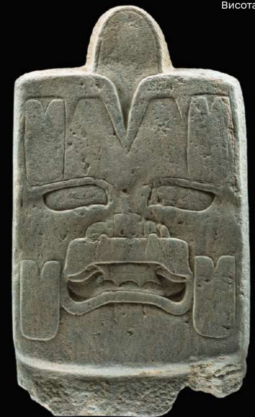
Зображення божества 1200-900 рр. до н. е. Висота 73 см