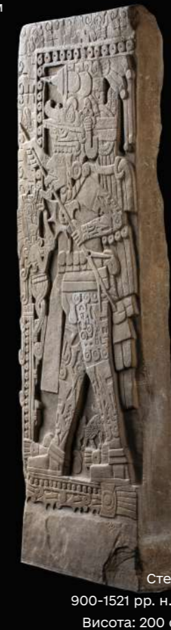
Стела 900-1521 рр. н. е. Висота: 200 см