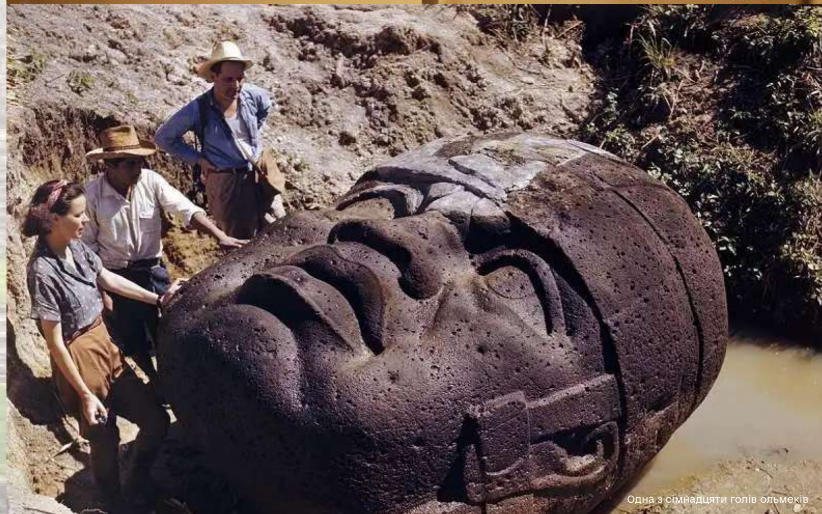
Одна з сімнадцяти голів ольмеків