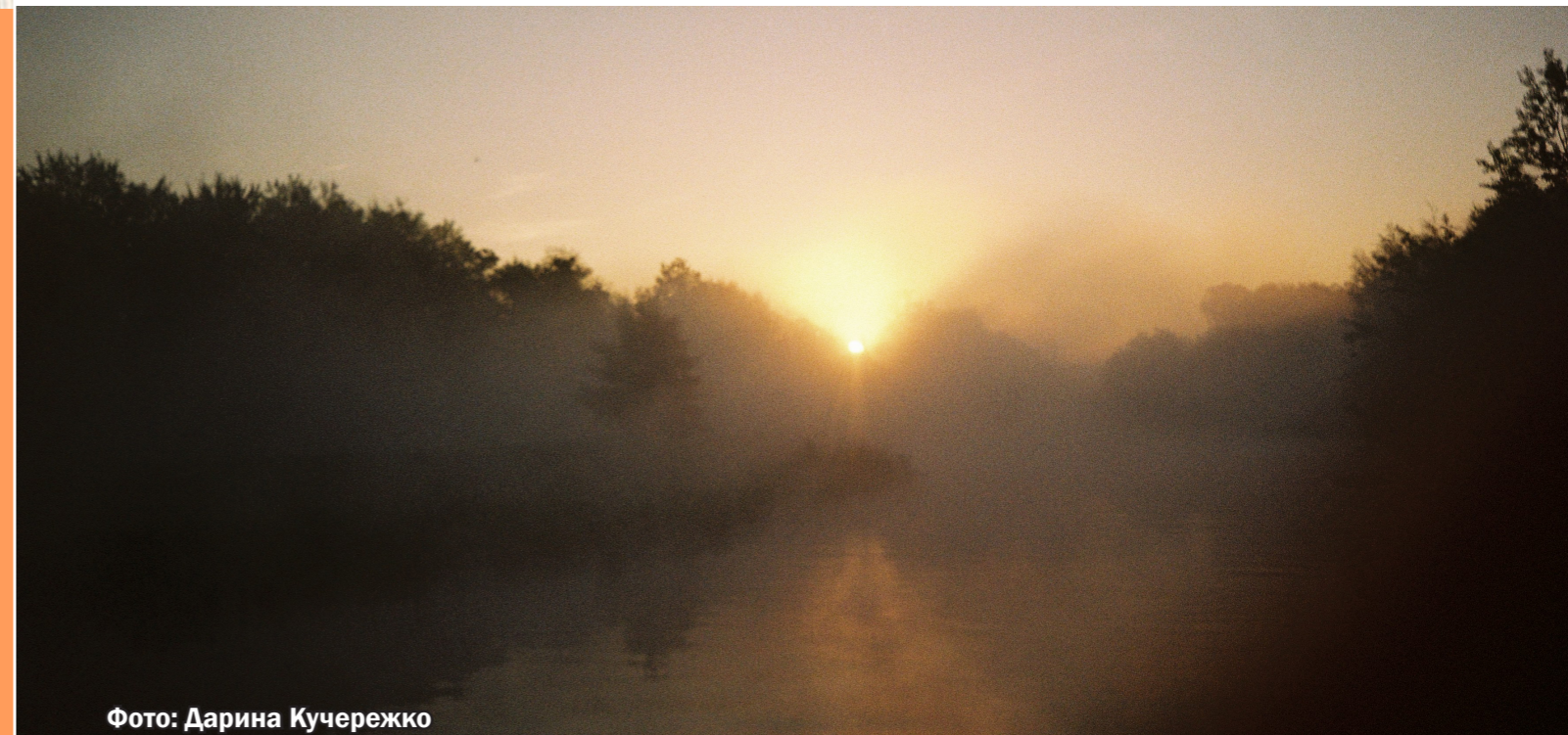
Фото: Дарина Кучережко