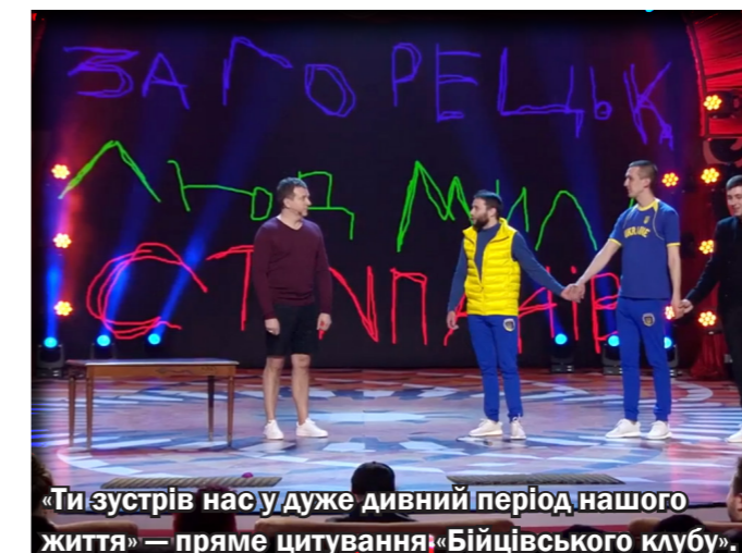
«Ти зустрів нас у дуже дивний період нашого життя» — пряме цитування: «Бійцівського клубу».

Виступи «ЗЛС» — команди зі щорічного фестивалю гумору «Ліга сміху» — змусили звернути увагу навіть тих, хто негативно ставився до цього телешоу. Що і не дивно: їхній гумор підкреслено «антикавеенішний». Тобто, якщо більшість команд розробляли детальні сценарії, з купою номерів, танцювальних та музичних вставок, то ці хлопці створювали враження відсутності чіткого сценарію, виступ ніби представляє собою недолугу імпровізацію, актори виглядають повністю непідготованими та байдужими до власної «некомпетентності». Ба більше, «загорецькі» розігрують відкритий конфлікт зі своїм тренером, а у своєму найпершому виступі прозоро натякнули всім тренерам