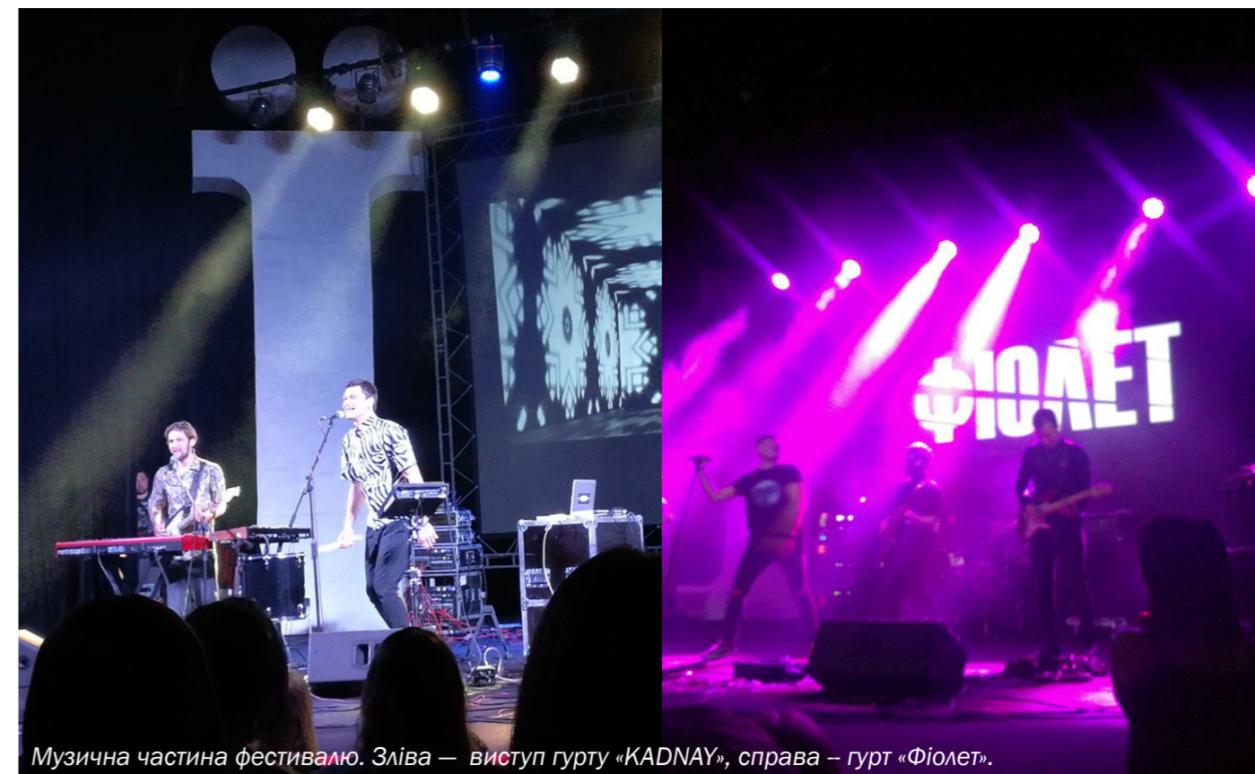
Музична частина фестивалю. Зліва — виступ гурту «KADNAY», справа — гурт «Фіолет».

Література займала чи не найбільшу частку заходів. Учасниками фестивалю були такі відомі представники сучасної української літератури, як Оксана Забужко, Юрій Андрухович, Мар'яна Кіяновська, Сергій Жадан, Мар'яна Савка, Олександр Ірванець, Юрій Іздрик. Фішкою кожного заходу була можливість поспілкуватися з гостями, поставити їм свої питання — або із залу, або після завершення вже за сценою. Заходи починалися з самого ранку і тривали до пізньої ночі. Організатори також випробували крутий формат «сніданків із літератором», де у затишній атмосфері кафе можна було поспілкуватися із письменниками і поетами та глядачами, які знайшли у собі сили прокинутися вранці.