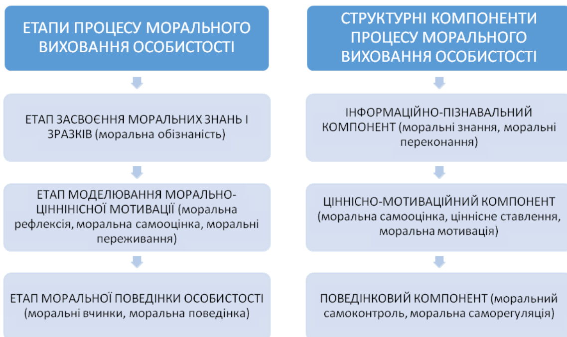
Рисунок 1. Схема взаємозв'язку структурних компонентів морального виховання

3) Поведінковий компонент - відповідністю поведінки та вчинків особистості юнацького віку загальнолюдським моральним нормам. Виокремлені етапи та структурні компоненти морального виховання особистості здобувачі освіти схематично презентовані у розробленій нами схемі морального виховання здобувача освіти (рис. 1.).