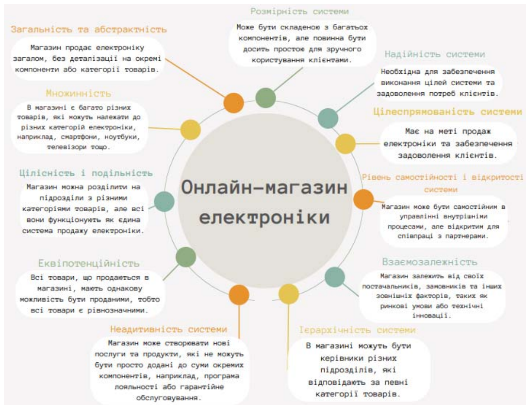
Рис. 1. Мапа думок. Властивості системи. Онлайн-магазин електроніки.

Розглянемо декілька прикладів для представлення результатів за допомогою мап думок (сервіс LucidChart). Зокрема, застосуємо до вивчення основ менеджменту. Нижче наведемо опис властивостей системи організації онлайн-магазину електроніки (Рис. 1):